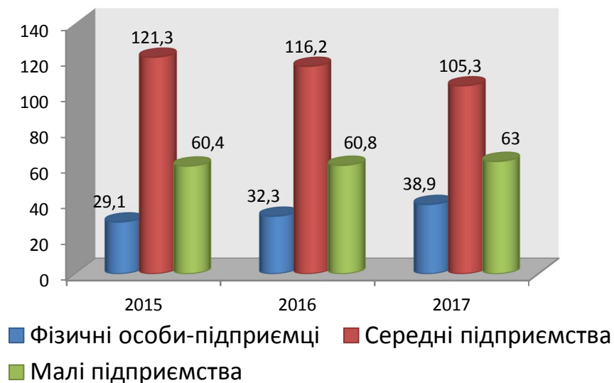
Рис. 3. Кількість найманих працівників на МСП за 2015-2017 роки

Кількість найманих працівників у фізичних осіб-підприємців за 2017 рік збільшилась на 12 % і склала 38,9 тис. осіб.