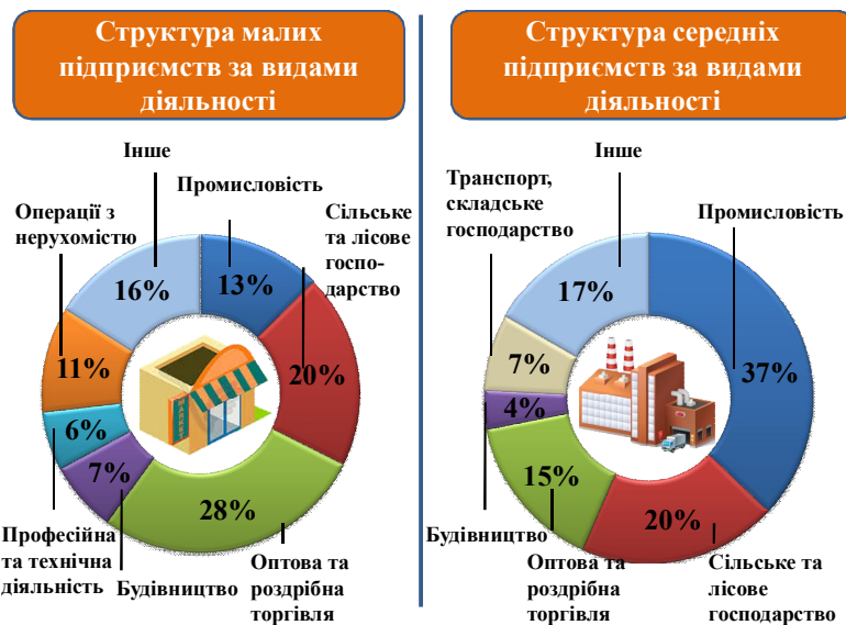
Рис. 1. Структура малих і середніх підприємств за видами економічної діяльності у 2017 році, відсотки

За структурою найбільша частка загальної кількості малих підприємств була зосереджена у сфері (Рис. 1): оптової та роздрібної торгівлі, ремонту автотранспортних засобів і мотоциклів – 3819 одиниць; сільського, лісового та рибного господарства – 2765 одиниць. Середні підприємства найбільш зосереджені у сфері: промисловості – 220 одиниць; сільського, лісового та рибного господарства – 114 одиниць; оптової та роздрібної торгівлі; ремонту автотранспортних засобів і мотоциклів – 86 одиниць.